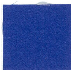
Royal blue 4128-04997