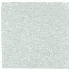
Pearl grey 4128-10001